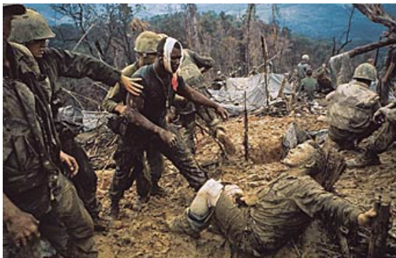
Retrouvailles après une dure attaque. Le reporter qui a fait cette photo est mort au Vietnam.

Mais imaginons que les Américains obtiennent très vite ce pour quoi ils seront venus, c'est-à-dire la mort de Saddam Hussein. Que se passera-t-il en Irak? Que se passera-t-il au Proche-Orient? Que se passera-t-il ailleurs dans le monde?