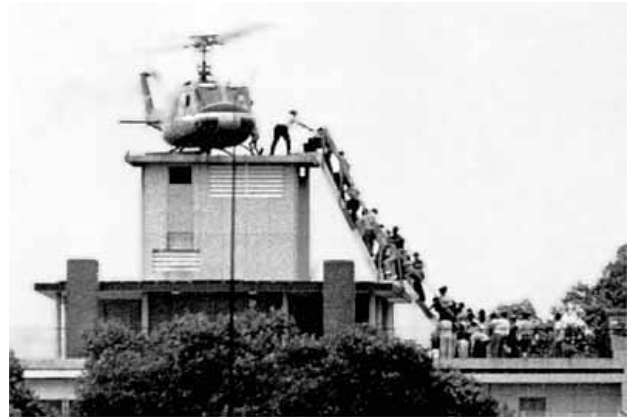
Dernier hélicoptère à quitter Saïgon en 1973

Et ailleurs dans le monde ? Vraiment, vous croyez que nous autres, Occidentaux, pourrions rester longtemps chaudement assis sur nos couilles ? Peu importe que la France ait ou non participé directement au conflit, comme les Anglais ne manqueront pas, eux, de le faire. Nous sommes des mécréants. Il y aura des attentats dans l'une ou l'autre capitale européenne, perpétrés par quelques allumés islamistes. Et de nombreux morts, car ces attentats se feront à l'acétylène, au sarin ou aux déchets radioactifs.