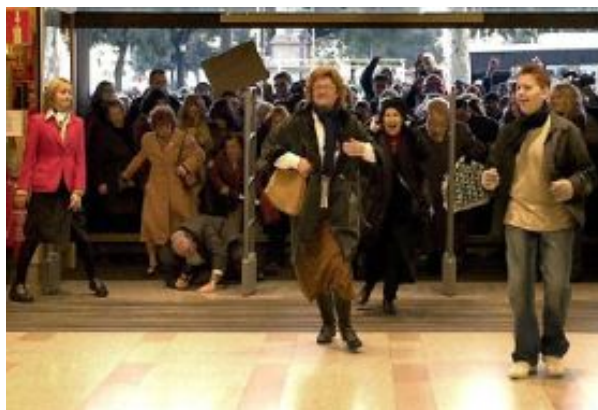
Soldes dans un grand magasin

Le marché n'est finalement motorisé que par la frustration, c'est-à-dire l'inassouvi répété de la névrose. Le bien consommé est consumé avant d'être possédé dans son entier. Il disparaît toujours dans l'usage qui en est fait et aucun ingénieur n'aurait plus l'idée saugrenue de mettre sur le marché un bien inusable. Bien que l'industrie en soit capable. L'obsolescence de l'objet est calculée pour en faire l'objet le plus éphémère possible. Minimiser la durée, maximiser le plaisir: telle est la loi des plaisirs décroissants.